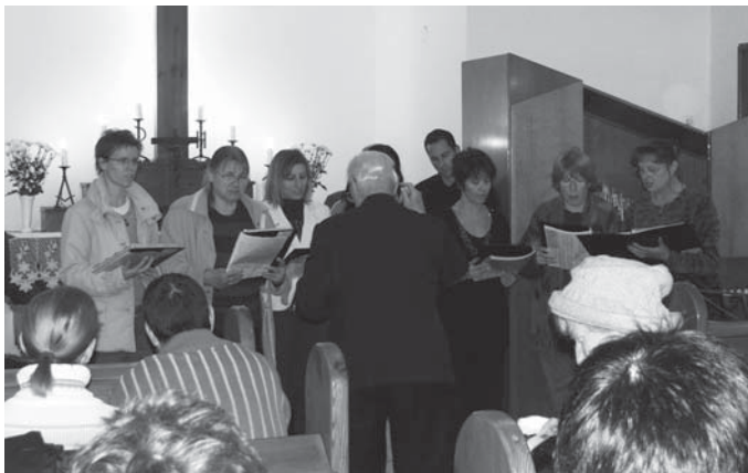
Rákoscsabai „Ki mit tud?”, gyülekezeti énekkar

Épp 10 éve, 2001-ben kezdtük el a bibliaórát. (Akkor csak Keresztúron és Hegyen volt ilyen alkalom.) Azóta is megvagyunk. 15-en kezdtük, ma is ennyien vagyunk, pedig – sajnos – hatan már előrementek. Szerdánként jövünk össze, énekelünk, aztán az Útmutató ígéről mondok néhány szót. Idén a Római levelet olvassuk közösen. Magyarázom a szöveget, mert fontosnak tartom, hogy értsük is, amit hallunk vagy olvasunk. Végig vettük többek között a 150 zsoltárt,