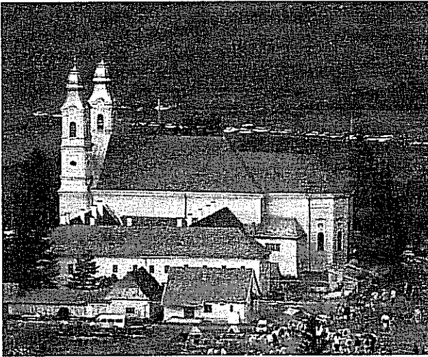
A csíksomlyói ferences kegytemplom és rendház

csángó-magyarokkal, akiket a Vatikán hatalmi politikája elrománosított, akikkel napjainkban, sok esetben már csak a somlyói kegyhely jelent kapcsolatot. Az 1989-es fordulat újabb jelentéstartalmat adott e búcsúnak. Immáron a Kárpát-mendence katolikus magyarjainak egységét is szimbolizálja a csíksomlyói búcsú.