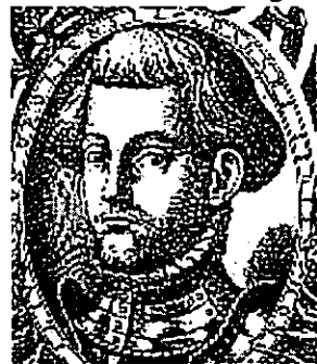
János Zsigmond, az első erdélyi fejedelem

A székelyek legnagyobb ünnepe a csíksomlyói pünkösdi búcsú. Óriási tömegben jönnek ide a székely, csángó és magyar zarándokok, Máriát dicsérik, Szent Fia közbenjárását kérik. A kegytemplom föltára díszeként áll a Csíksomlyói Segítő Mária nagy faszobra nagy magasságban Szent István és Szent László király szobra között. A székely nép Mária-kultusza valószínűleg a régibb időkig megy vissza, a „napba öltözött asszony” már a kereszténység felvétele óta a nép fő pártfogója és imáinak tárgya lehetett. A kegytemplom helyén a hagyomány szerint az itt letelepült bencések építettek először román stílusú templomot. Arról nincs adat, hogy ők mikor távoztak, és mikor kerültek ide a ferencesek, akik ma is Csíksomlyón vannak. Mária és a két király