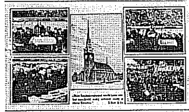
Rákoskeresztúr: 1943. november 14.

Hívjuk és várjuk az ünnepi alkalmon, adjunk hálát a templomért, köszöntsük jubiliáló lelkészünket november 14-én vasárnap, 16 órakor Rákoskeresztúron.