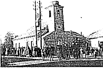
Rákoskeresztúr: 1943. október 30.

A Rákoskeresztúri Evangélikus Egyházközség hálaadással és laudációs előadásokkal mond köszönetet Istenének templomáért és ad hálát a gyülekezetben végzett lelkész szolgálatát november 14-én 16 órakor a rákoskeresztúri templomban.