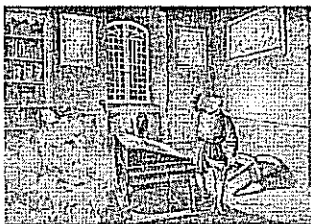
Luther legendák: A tintartató

Testvérem! "Az igaz ember pedig hitből fog élni." Él ez az íge szívedben?