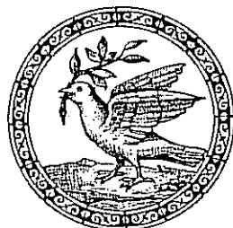
Galamb olajággal. Schmid: Mímtakönyv

Az első országos hittanversenyük után ők is elmondhatják: Jöttünk, láttunk, (tudtunk), győztünk – Istennek legyen hála!